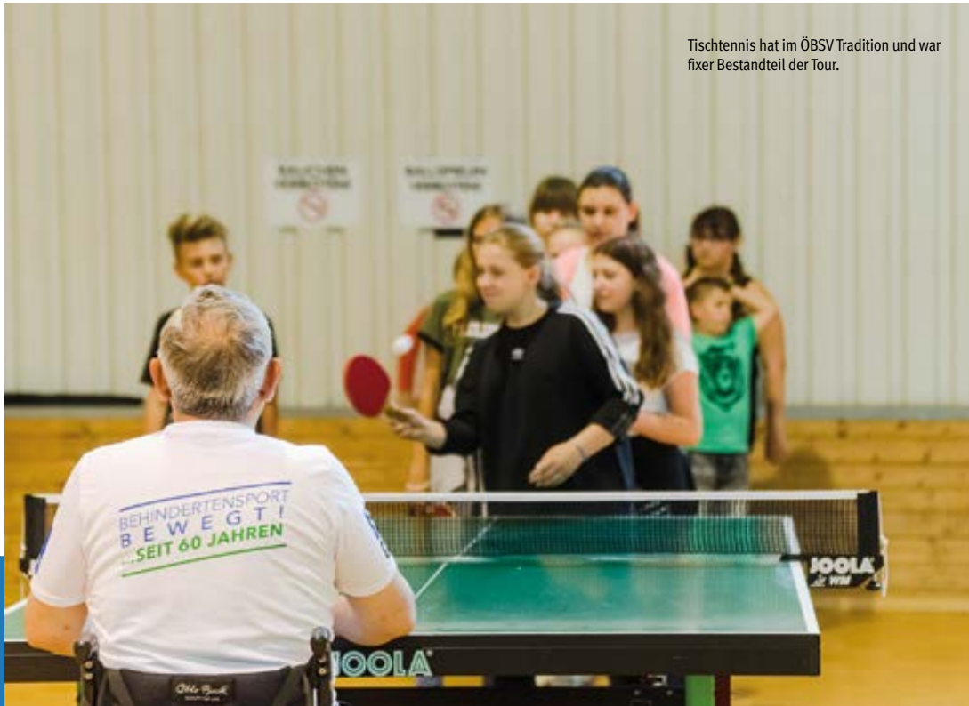
Tischtennis hat im ÖBSV Tradition und war fixer Bestandteil der Tour.