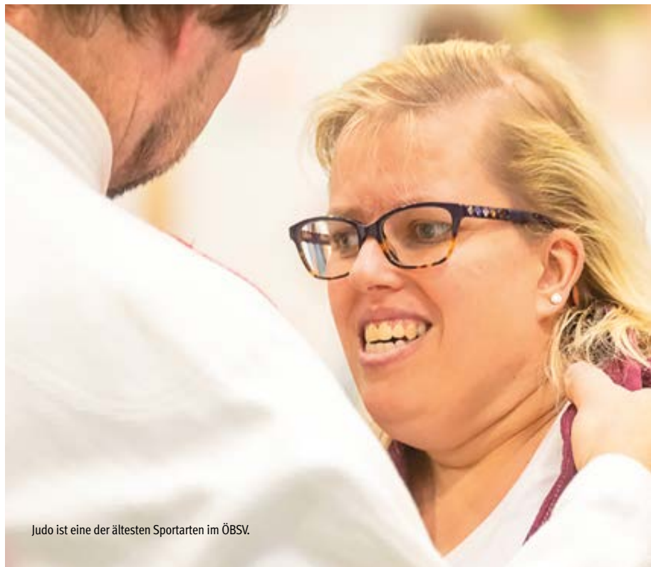
Judo ist eine der ältesten Sportarten im ÖBSV.