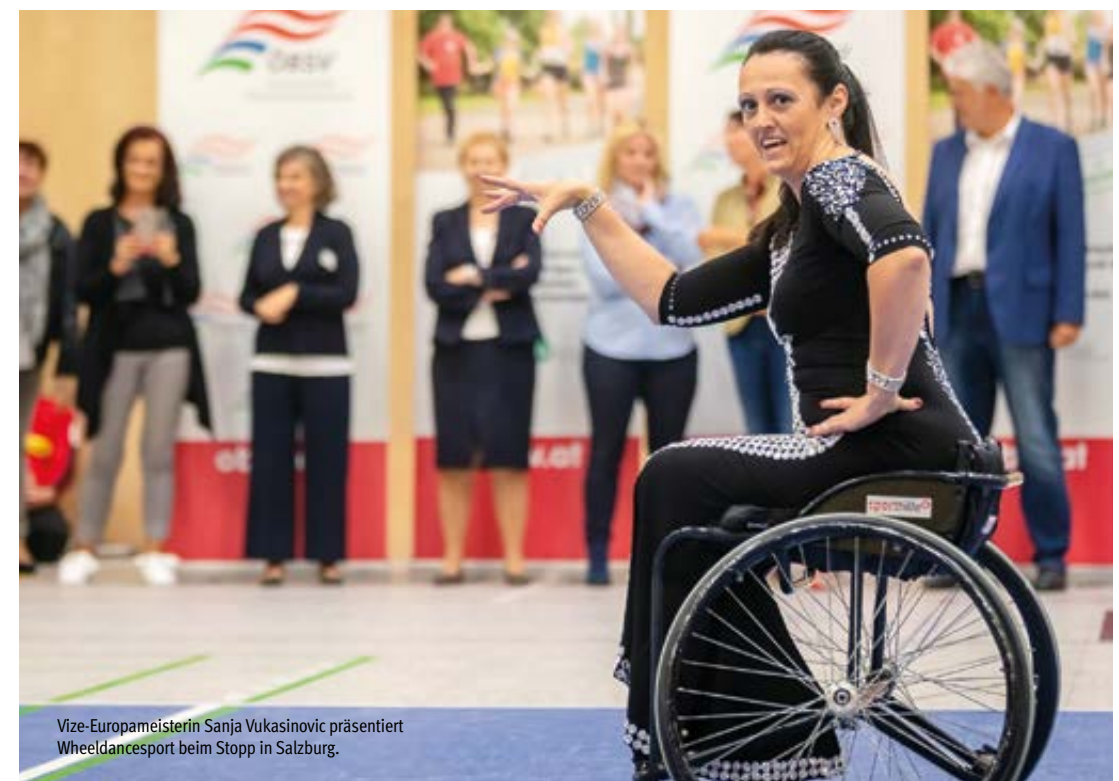
Vize-Europameisterin Sanja Vukasinovic präsentiert Wheel dancesport beim Stopp in Salzburg.