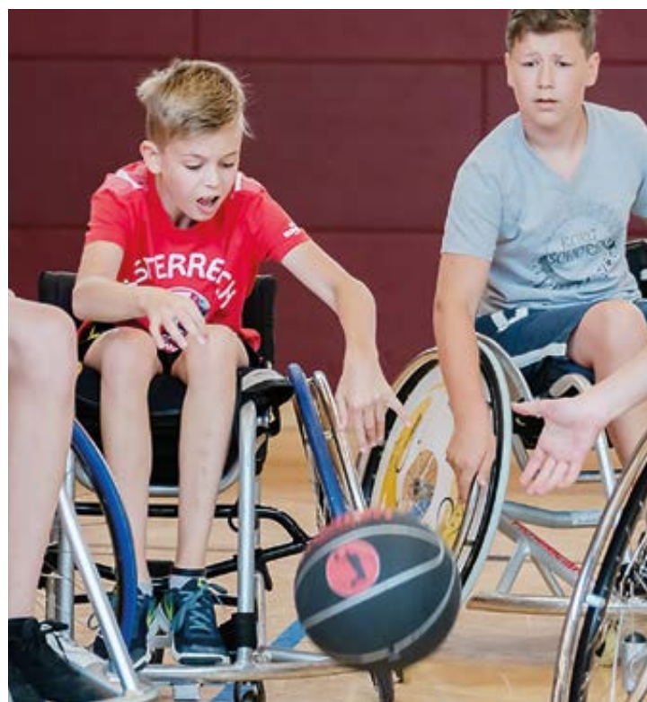
Kids probieren sich in der Schwerpunkt-Sportart Rollstuhl-Basketball.