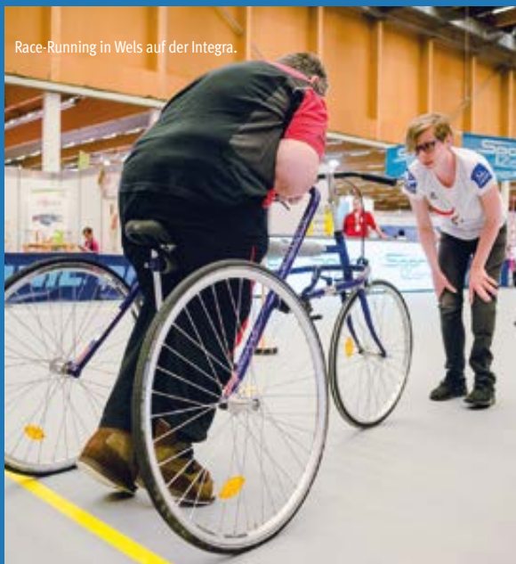
Race-Running in Wels auf der Integra.