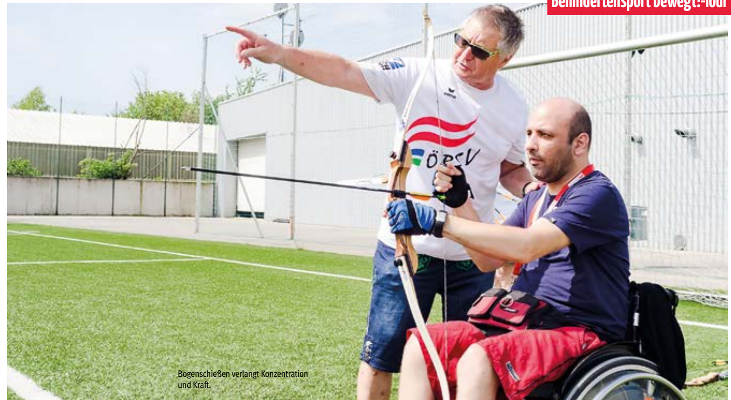
Bogenschießen verlangt Konzentration und Kraft.